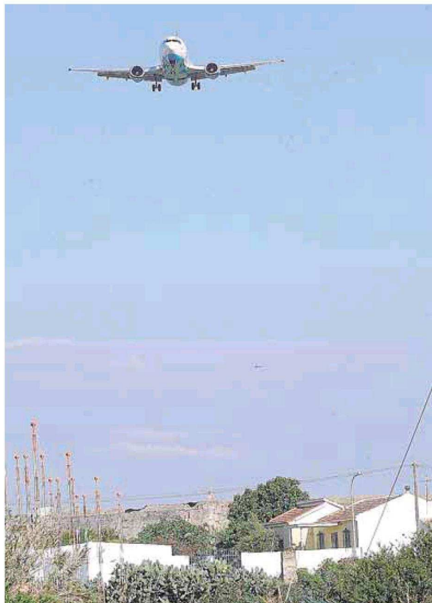
Un avión sobrevuela viviendas del carril de San Isidro.

Los planos aún pueden sufrir modificaciones ya que acaba de salir a