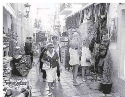
Vista de una calle comercial en el centro de Marbella.

Alegria, satisfacción, pero también miedo es lo que sienten los que, cada vez más, deciden autoemplearse y competir contra las grandes superficies con un negocio tradicional que nunca imaginaron pero que supone su tabla de salvación.