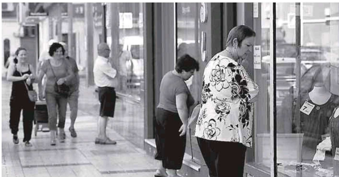
Algunos comerciantes detectan en sus clientes una mayor alegría a la hora de gastar.