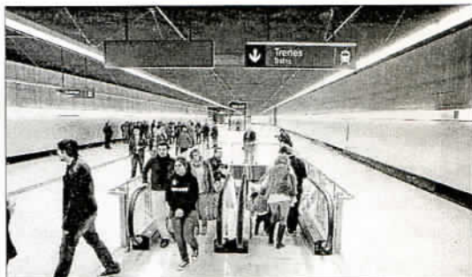
Las estaciones están diseñadas sin recovecos. ÁLEX ZEZA

Los usuarios podrán recuperar el importe de su billete siempre que el servicio se interrumpa durante más de una hora, por lo que el personal le extenderá un justificante para proceder a su reintegro. Además, también se prevé devolver el billete si hay un retraso en el tren de más de 15 minutos cuando la frecuencia de paso sea inferior a los 8 minutos, algo que se produce de lunes a viernes hasta las 20.00 horas. También si se produce un intervalo entre trenes que dupliquen la frecuencia de paso prevista, que en el caso de los fines de semana y horario nocturno serían 20 minutos.