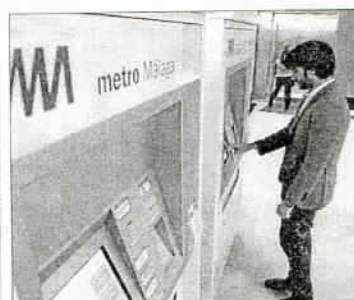
Máquinas expendedoras. L. D.

Las máquinas expendedoras están adaptadas para personas con discapacidades visuales. Además, poseen un interfono para que pueda comunicarse con el personal de Málaga ante cualquier incidencia o necesidad de información.