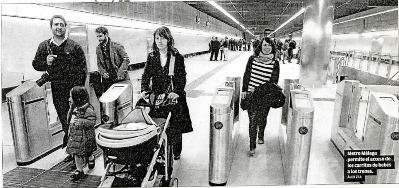
Metro Málaga permite el acceso de los carritos de bebés a los trenes. ALEX ZEA

Las máquinas validadoras o tornos están señalados con una flecha verde o un aspa para indicar cuál está abierto. Sólo habrá que pasar la tarjeta por el lector situado en la parte superior y el torno franqueará el paso, al salir los billetes sin contacto que no necesitan introducirse en una ranura. En la pantalla se informará del saldo que queda en la tarjeta. Estos dispositivos también tendrán un interfono junto a la línea de validación.