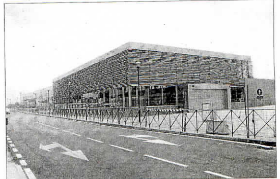
Estación de Palacio de Deportes, donde habrá parking para bicis. A.V.

Así, la vinculación con la bicicleta permitirá ampliar el radio de influencia de una estación de metro, que se calcula en 500 metros. En cambio, gracias al apoyo de la bicicleta y los carriles bici, el área de influencia del transporte pú-