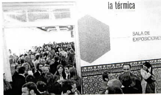
Numeroso público asistió al estreno de La Térmica.

Miradas que ahora quiere captar La Térmica con 'Lady Warhol' y un intenso programa de actividades desplegado para su primer trimestre de vida. «La filosofía de La Térmica es generar nuevas ideas», siguió Bendodo, quien destacó que 'Lady Warhol' representa «una muestra inédita en España».