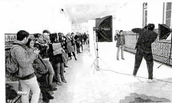
Los invitados posaron en las galerías de La Térmica.

Representantes de la Fundación Albéniz y La Fábrica acudieron a la inauguración