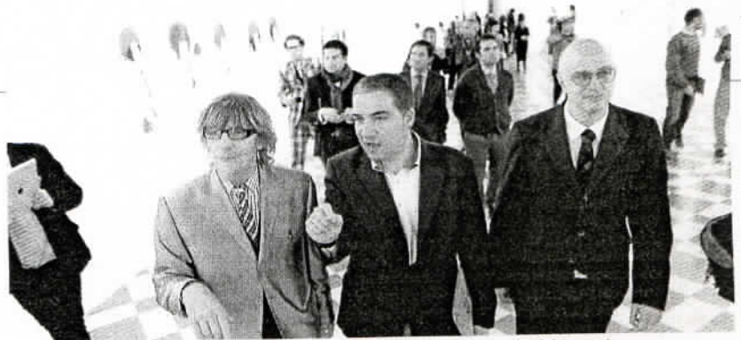
Los responsables de la Diputación y de La Térmica, ayer en la inauguración del montaje.