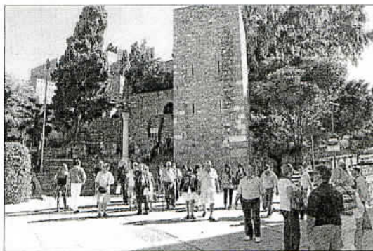
Turistas por el Centro de la capital malagueña.

La respuesta del Gobierno fue clara: no firma convenios con comunidades autónomas que hayan incurrido en déficit en los dos últimos ejercicios; algo que sí sucedió en Andalucía. Y, además, apuntó que el Ejecutivo regional adeuda un millón de euros y los ayuntamientos incluidos en el consorcio un total de 725.000 euros. «Nosotros tenemos un compromiso claro en materia turística