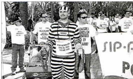
Los manifestantes repartieron chorizos a los ciudadanos. C. CRIADO