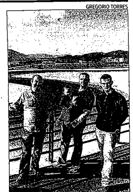
Socios delante de las pistas.

En todo caso, la asociación ha señalado que seguirá manteniendo la concentración de protesta del 5 de febrero hasta que re-