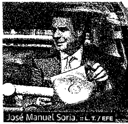
José Manuel Soria.

:: J. D. A. El Gobierno ultima estos días un nuevo «esquema impositivo» sobre todos los generadores de energía eléctrica con el que intenta frenar el llamado déficit de tarifa (la diferencia entre los costes reconocidos y los ingresos del sistema), que cerró 2011 en 24.000 millones de euros y se estima aumente en otros 6.500 millones hasta 2013. Así lo confesó ayer en Bilbao, durante una jornada organiza-