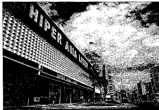
El Hiper Asia Líder, abierto en las antiguas cocheras de Portillo.