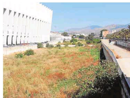
Vista del cauce desde el puente de La Rosaleda.

Los vecinos que viven en el entorno del arroyo del Café, tanto por la avenida Pintor Joaquín Sorolla como por la calle San Vicente de Paúl, insisten en que se lim-