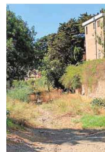
Arroyo de La Caleta.

pie el cauce de ese arroyo, ya que se quejan de que es el motivo de la presencia de mosquitos, cucarachas y ratas. Ya en julio pasado, vecinos de la zona de Bellavista denunciaron a este periódico la presencia de insectos y roedores que penetraban en las viviendas y que achacaron a la falta de lim-