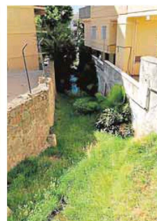
Arroyo del Café. :: J. M. A.