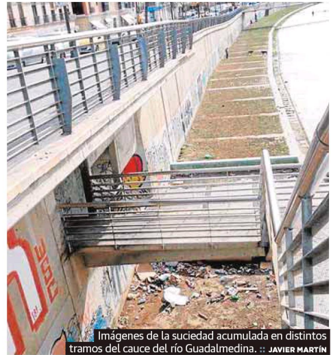
Imágenes de la suciedad acumulada en distintos tramos del cauce del río Guadalmedina.