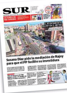
Tal y como reclamó este periódico el pasado fin de semana, se impone el sentido común para que las obras no se vean ralentizadas.

El cambio propuesto en el plan de obras del suburbano en la avenida