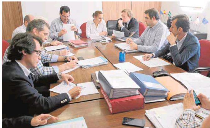
Técnicos del Ayuntamiento, la Junta y las constructoras, ayer durante la reunión.

Fomento mantendrá abierta la calle Nazareno del Paso en sentido Norte-Sur y el Consistorio acepta el plan general de desvíos de tráfico