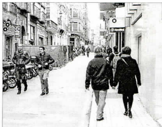
Las calles Casapalma y Cárcer serán remodeladas este año. ARCHINEGA

De forma complementaria, hay cuatro edificios en construcción o terminados en el Centro que buscan aportar cierta actividad en zonas degradadas. Así está el Centro de Estudios Hispano-Marroquí en la Plaza del Teatro y la ludoteca de la plaza del Pericón. Además, se está construyendo un centro cívico en la calle Dos Aceras y un centro de emprendedores en la calle Nosquera, este último, además, vinculado a una promoción de VPO destinados a jóvenes emprendedores.