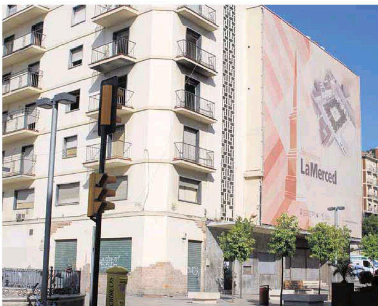
La manzana de los cines Astoria y Victoria está en manos del Ayuntamiento desde hace cuatro años. :: SUR

Todo ello combinado en cualquier caso con el uso de mercado y también con la posibilidad de dedicar como máximo un 20% de la superficie construida a negocios de hostelería, tal y como establece la calificación urbanística aprobada para la parcela.