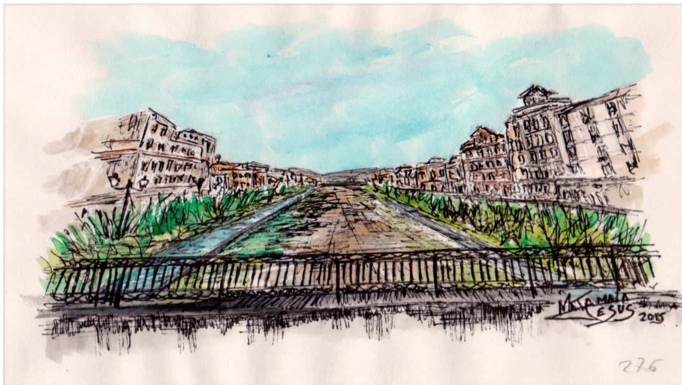
Río Guadalmedina