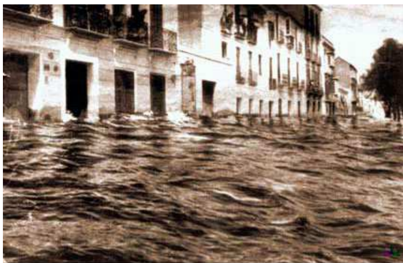
Inundaciones de 1907