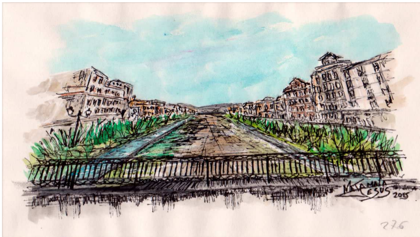
Río Guadalmedina