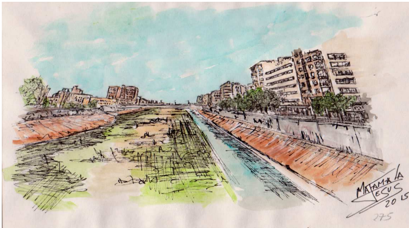
Río del Guadalmedina - Dibujo: Jesús P. Matamala

Un día después se publicó una convocatoria para celebrar una nueva asamblea, en la que participarían todas las actividades, empresarios, patronos y obreros para pedir al Gobierno la desviación del Guadalmedina. ¡Que si quieres arroz, Catalina! Ni caso.