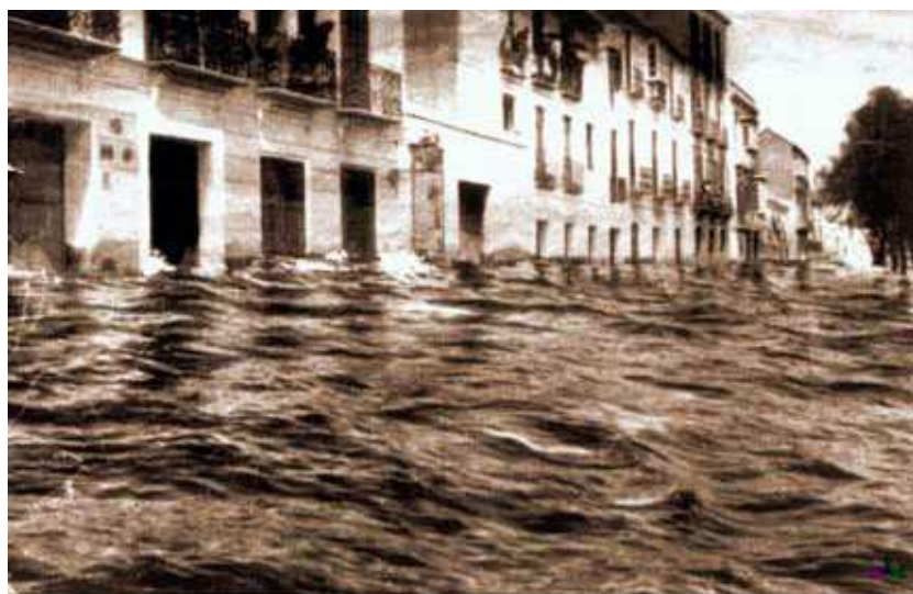
Inundaciones de 1907